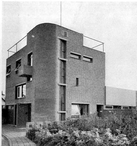
Haus eines Arztes in Holland (Seite 131)